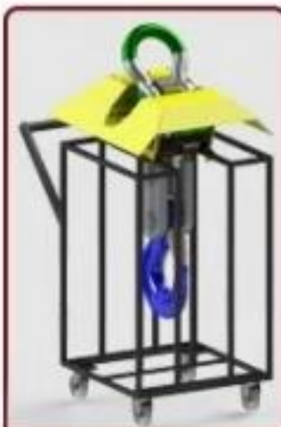
Acessório Carrinho para Transporte