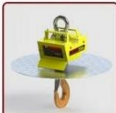
Acessório Disco Atenuador de Calor

*Consulte Outros Acessórios para Balanças Suspensas