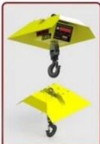
Acessório Chapéu contra Sol e Chuva

Obrigatoriamente a manilha (alça superior da balança) deve estar assentada no colo do gancho